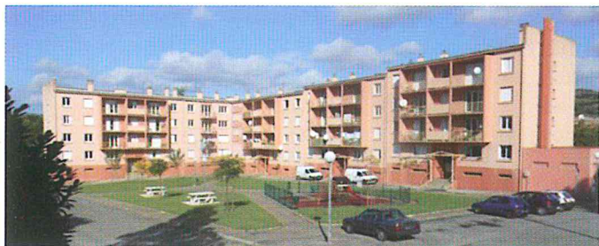
Un nouvel espace aux HLM Pyrénées.

L'espace vert au pied de l'HLM Les Pyrénées était à l'abandon depuis des années voire des décennies. Il a été engazonné, arboré et des bancs et tables ont été posés à proximité des arbres. Un espace de jeux clôturé a été créé où les jeunes enfants peuvent enfin s'amuser en toute sécurité.