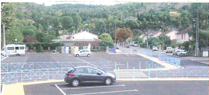
Le parking place Kennedy, flambant neuf.

La lutte contre la vitesse excessive sur le boulevard Charles de Gaule et la place Kennedy nous a amené à redessiner la route la traversant pour rejoindre l'avenue René Cassin. Ce nouveau tracé, en plus de ralentir les véhicules, a libéré suffisamment d'espace pour créer un parking de 60 places. Le transfert du marché dominical sur la rive gauche de l'Aude libère la place Kennedy qui peut accueillir dorénavant toutes les foires.