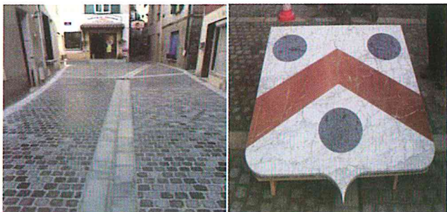
La rue Voltaire pavée et le blason

Les travaux d'amélioration des ruelles du centre ville entreprise par l'équipe municipale précédente ont été revus et la population a été invitée à choisir le modèle et la couleur des pavés qui recouvrent maintenant celles-ci. Un blason aux armes de la ville orne la placette devant la superette. Les travaux de voirie sont réalisés en tenant compte de la nécessité de l'accessibilité des commerces et autres locaux professionnels aux personnes à mobilité réduite, selon nos promesses.