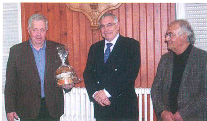
Remise de la première brioche.

L'ancien poste de police a été transformé en « Maison du Social » et la priorité a été donnée au service des personnes âgées. Ainsi elle héberge la référente du Service d'Aides à Domicile de la C.C. Pyrénées audoises; l'assistante sociale; les associations Familles Rurales, Les Petits Frères des Pauvres, L'Ecole des Parents avec la permanence d'une psychologue bénévole. En outre, des séances de gymnastique d'entretien de la mémoire sont dispensées gratuitement chaque jeudi à partir du mois d'octobre au centre Alibert.