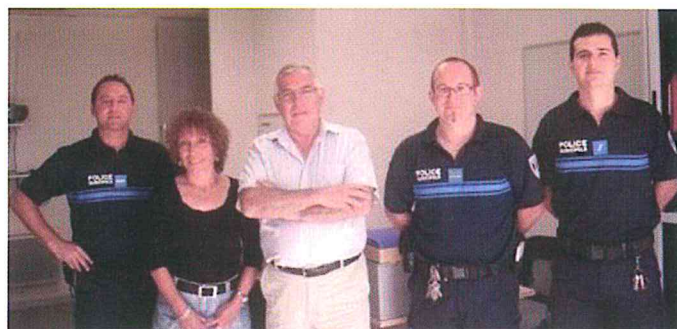
La police municipale dans les nouveaux locaux

Pour une meilleure sécurisation du centre ville, le poste de police municipale a été transféré sur la place de la République. Le service a été renforcé par une secrétaire et équipé en informatique. Le personnel a été équipé de bicyclettes, de gilets pare-balles, de lassos pour la capture des animaux errants. Bientôt, ils seront porteurs de caméras-piéton. Les policiers municipaux participent à la surveillance du marché dominical et sont habilités à mettre en fourrière les véhicules en infraction. Enfin, après avoir consulté la population Espérazanaise, nous avons voté la mise en place d'un dispositif de vidéo-protection.