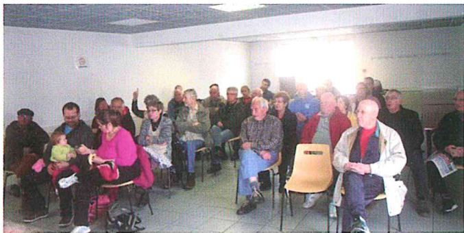
Les réunions de quartiers, un rendez-vous attendu.

L'équipe municipale s'est mise au travail afin de trouver le plus rapidement possible des solutions durables aux différentes remarques qui ont été faites.