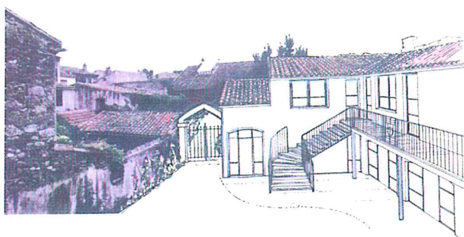
Le projet du presbytère.

Des opportunités se sont présentées dès le début du mandat : l'achat du presbytère, 75 000€ tous frais compris et la maison de M. Raous, attenante, 30 000€. Ces acquisitions ont permis l'élaboration d'un projet d'espace culturel comprenant une Maison des Arts et de l'Artisanat et un espace dédié aux expositions en plein air. L'ensemble présentera à la location deux logements, trois studios et six ateliers-vitrines. Ce projet permet la création d'un emploi de gardien du site.