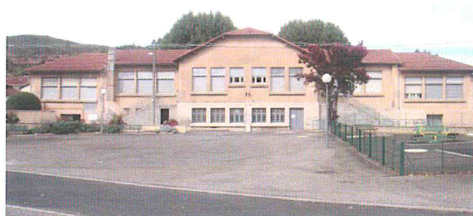
Le square du 8 mai et l'entrée des écoles

Notre volonté de sécuriser les entrées des écoles nous a entraîné vers la création de deux escaliers symétriques s'intégrant harmonieusement dans l'architecture du bâtiment. La démolition du bâtiment technique de l'opérateur Orange a dégagé la vue et permet de découvrir l'ensemble de la façade. La réfection du square et la création des escaliers participent à l'embellissement d'Espéaza. La découverte de ce lieu quand on descend par l'avenue de Perpignan est un ravissement.